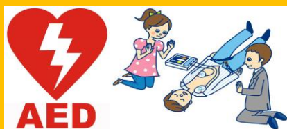
学习 AED 使用方法吧!

请用传真或者通过电子邮件来报名。报名时请写明你的名字、国籍、住所、性别、联系电话、年龄。如果不是在中央区的居住者, 也请写明你是否在中央区工作。