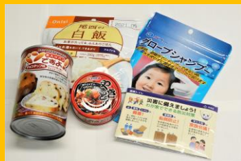
中央区送你们防灾用品!