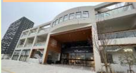
はるみちいきこうりゅう 晴海地域交流センターはるみらい