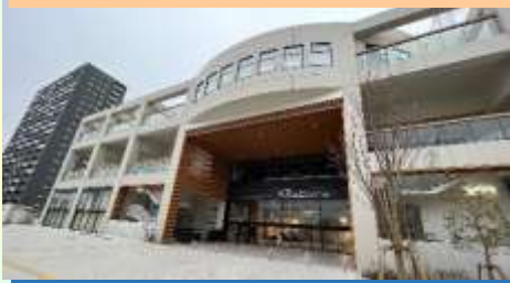
하루미 지역교류센터 하루미라이

친구와 함께 하는 공간과 트레이닝 스튜디오 등을 갖춘 지역 주민의 교류 거점