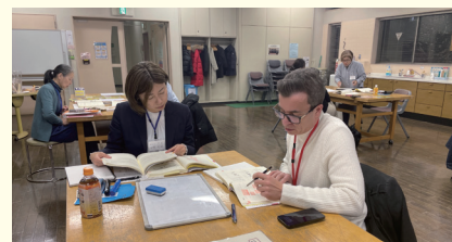
令和 6 年度日本語教室