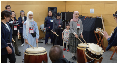
令和6年度国際交流のつどい（和太鼓ワークショップ）

Events: Experiences of Traditional Japanese Culture, International Exchange Salon, Disaster Preparedness, etc.