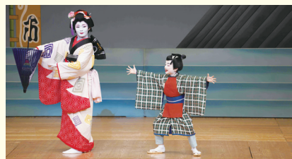
令和6年度古典芸能鑑賞会