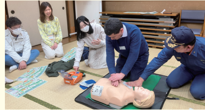
令和 6 年度国際交流サロン（防災訓練）

Events: Seaweed, Japanese Sweets, Tea Ceremony, Bon Dance, Emergency Drill, etc.