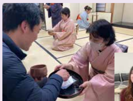
●呈茶・茶道体験 Tea Ceremony Experience