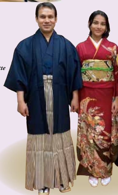
●着付け Kimono Etiquette