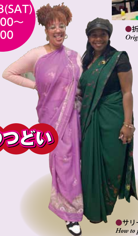
●サリー着付け How to put on a Sari

教育会館で「つどい」が開催されました。多くの人が集まり文化や遊びを楽しみました。