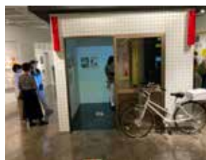
③ポリスミュージアム（警察博物館）