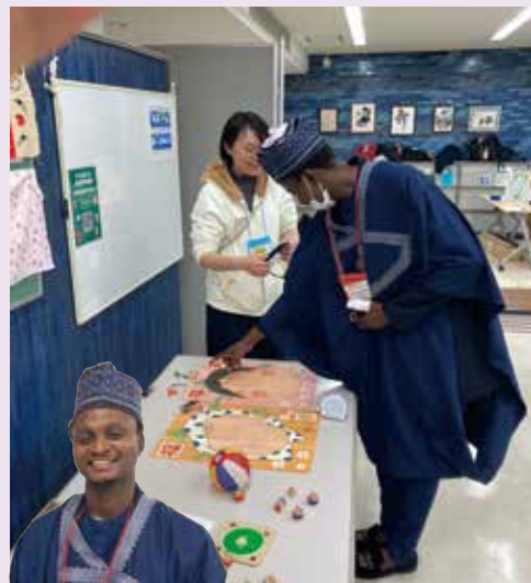
●日本の遊び・海外の遊び Japanese Games・Foreign Games