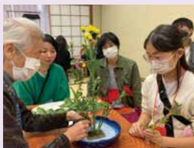
●生け花体験 Flower Arrangement Experience