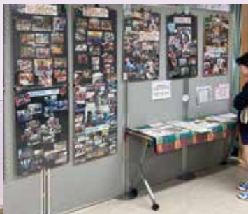
●スリランカパネル展 Panel Exhibition of Sri Lanka