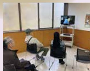
●防災コーナー Disaster Preparedness

も様々な国からの参加者たちが着物に袖を通し、目を輝かせていました。サリーは、着たまま館内を自由に行き来できるのが魅力。異国ムードをまといながらイベントを満喫できました。「食」では、「けんちん汁」や「スリランカミルクティー」が振る舞われました。けんちん汁は、鶏肉、しいたけ、ゴボウなど12種類入りで具だくさん。スリランカミルクティーでは人気のレモンクッキーなどのおやつも並び、贅沢なティータイムを楽しめました。「茶道」体験では、薄茶と抹茶の2つのプログラムが登場。薄茶の「呈茶・茶道体験」では、和菓子をいただきながら掛け軸や香合といった「お床」のおもてなしについても知ることができました。「抹茶の点て方体験」