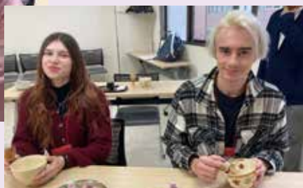
●抹茶の点て方体験 Matcha Making Experience