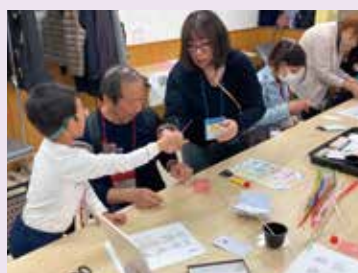
●水引細工 Mizubiki Workshop

「中央区国際交流のつどい」は外国人と日本人との交流を推進するため、日本や諸外国の文化を紹介し合い交流するイベントです。中央区文化・国際交流振興協会が、ボランティアの方々と協働して毎年秋に開催。今年で29回目を迎えました。今年の参加者はのべ425人と大盛況で、会場となった築地社会教育会館には開場時間前からイベントを楽しみに待つ人たちの列ができました。このイベントの魅力は、体験を通じて多様な文化に触れられることです。今回も、衣、食、住、踊りや音楽、遊びなど、バラエティ豊かな18のプログラムが揃いました。「衣」では、「和服の着付け」と、スリランカの伝統衣装「サリー」の着付けが登場。外国人限定の和服の着付けは毎年大人気。今年