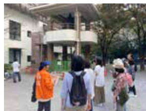
⑦まち歩きツアー 十思公園 石町時の鐘