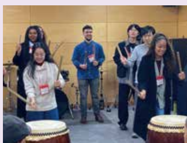
●和太鼓ワークショップ Taiko (Japanese Drum) Workshop

11月18日(土)、築地社会 第29回「中央区国際交流の 外国人101人を含む計425 日本をはじめ世界各地の伝統