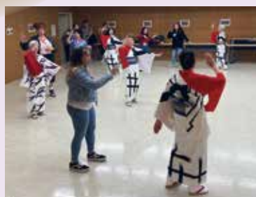
●盆踊り Japanese Bon Dance

では茶筌を片手に自分でお茶を点でて、美味しくいただきました。「住」空間を彩る「生け花」は、先着 60 名の限定体験。今年は、カーネーション、りんどう、菊、あおきが用意され、卓ごとに先生が付き、丁寧に教えてくれました。一方、住まいの安全を守るための情報などを紹介していたのは「防災コーナー」。各国語のガイドブックなども用意されていました。