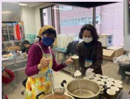
●スリランカミルクティー Sri Lankan Milk Tea