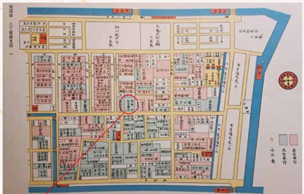
「加藤又左衛門」屋敷