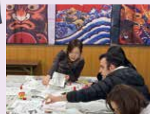
●凧づくりと凧の展示 Kite Making and Displays