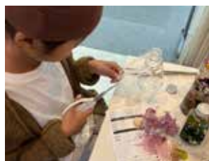
①気軽にツクル！ プチクラフト体験

今年もご参加いただきました皆さま、イベントにご協力いただいた全ての皆さま、有難うございました。この素晴らしいイベントがもっと多くの皆さまに伝わり来年も楽しんで頂けることを願います。