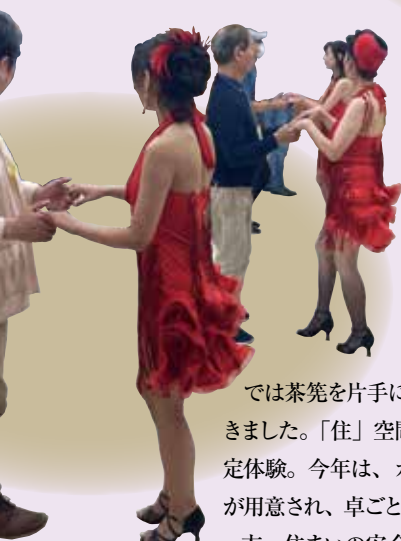
●サルサ Salsa Dance