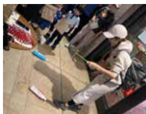
②京橋こども祭り～アジアのあそび～