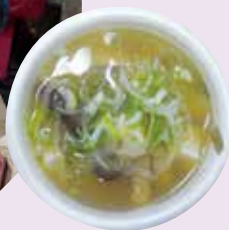
●日本の料理 Japanese Foods