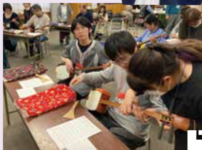
●長唄三味線を弾いてみよう！ Let's try Shamisen!

「来日して約1年。みんな学校は違います」 「中国と日本は似ている文化も多くて面白い」 「三味線を弾きました！」