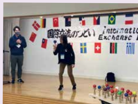
●けん玉実演 Kendama Performance

「中央区国際交流のつどい」は外国人と日本人との交流を推進するため、日本や諸外国の文化を紹介し合い交流するイベントです。中央区文化・国際交流振興協会が、ボランティアの方々と協働して毎年秋に開催。今年で29回目を迎えました。今年の参加者はのべ425人と大盛況で、会場となった築地社会教育会館には開場時間前からイベントを楽しみに待つ人たちの列ができました。このイベントの魅力は、体験を通じて多様な文化に触れられることです。今回も、衣、食、住、踊りや音楽、遊びなど、バラエティ豊かな18のプログラムが揃いました。「衣」では、「和服の着付け」と、スリランカの伝統衣装「サリー」の着付けが登場。外国人限定の和服の着付けは毎年大人気。今年