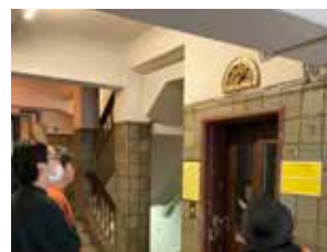
④昭和モダン 奥野ビルのエレベーター