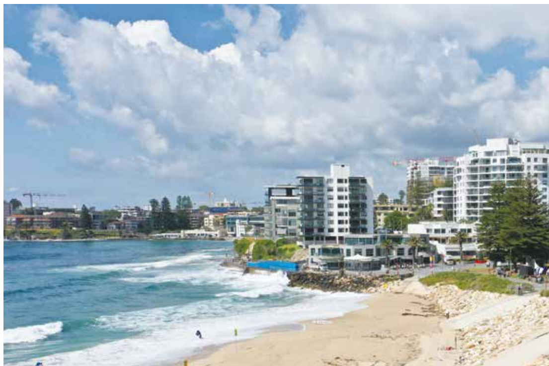
空、海、森、美しい街並み、魅力あふれるビーチに集う (オーストラリア サザランド市姉妹都市親善写真展)