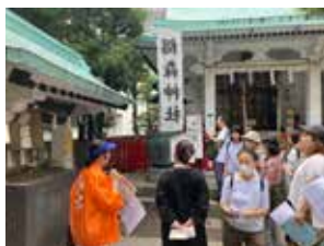
⑥まち歩きツアー 相森神社