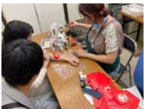
⑤築地ボディペイント