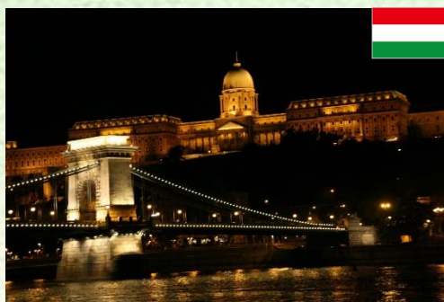
くさり橋と王宮 (ハンガリー/ブダペスト)