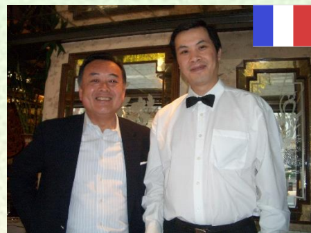
中華料理店のオーナーと(フランス/パリ)